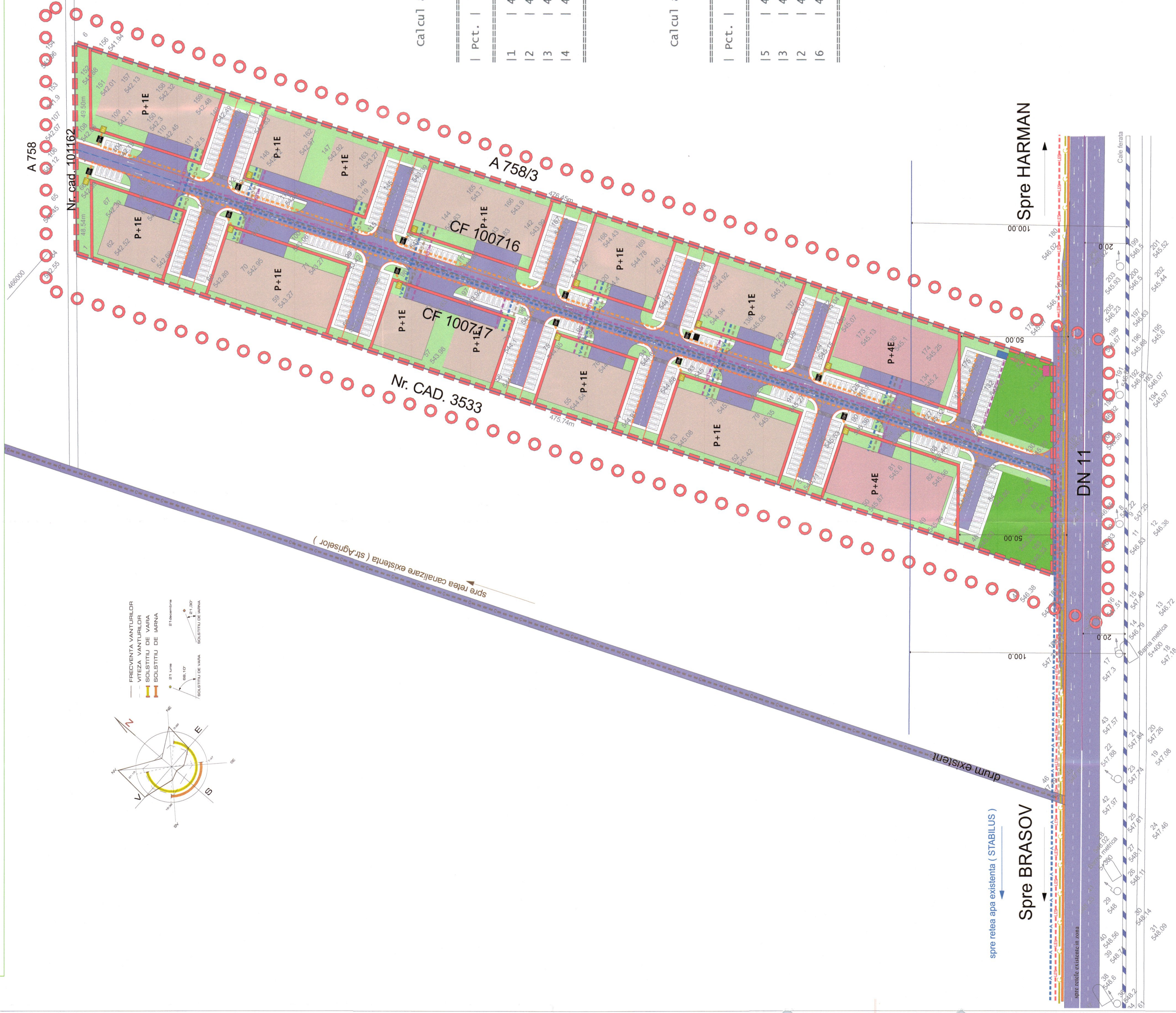
calcul analitic suprafata teren Nr. CAD. 100717